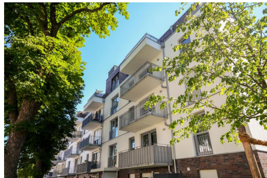
Balkon- & Fassadenstrangsanierung