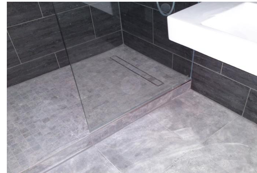
Sockelbau & Badsanierung